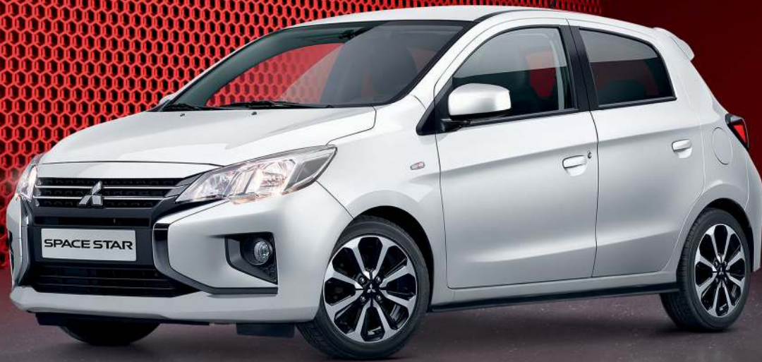
Abb. zeigt Space Star Select+ 1.2 Benziner 52 kW (71 PS) 5-Gang