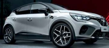
Abb. zeigt Serienfahrzeug mit nachträglich angebrachtem Zubehör.

Sie sind gern mit Fahrrädern unterwegs? Der ASX auch! Zum sicheren Transport von bis zu 3 Rädern bieten wir Ihnen Fahrrad-Träger in verschiedenen Varianten an. Wir beraten Sie gern.