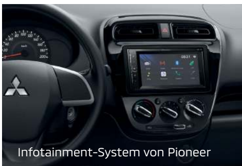
Infotainment-System von Pioneer