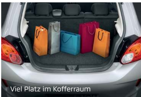
Viel Platz im Kofferraum