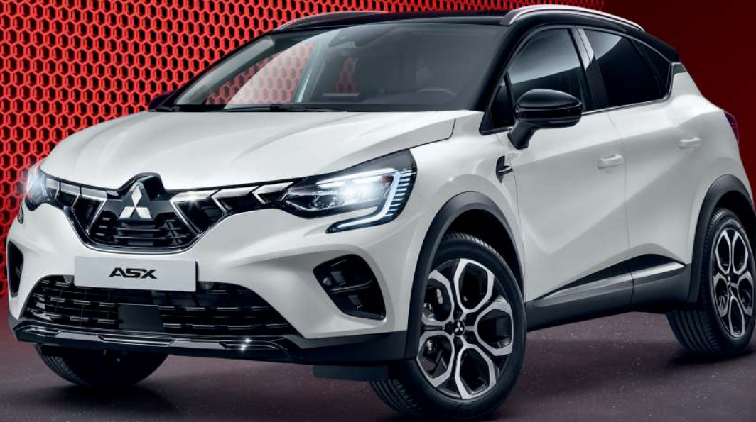
Abb. zeigt ASX Mildhybrid Select 1.3 Turbo-Benziner 116 kW (158 PS) 7-Gang-DCT