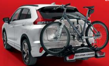
Abb. zeigt Serienfahrzeug mit nachträglich angebrachtem Zubehör.