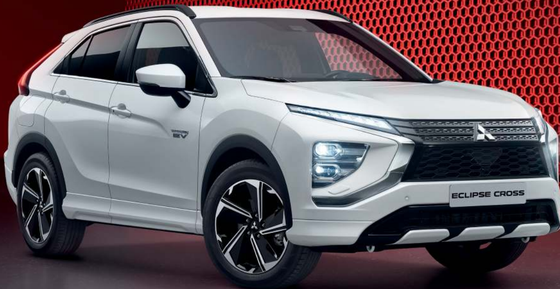
Abb. zeigt Eclipse Cross Plug-in Hybrid Select 4WD 2