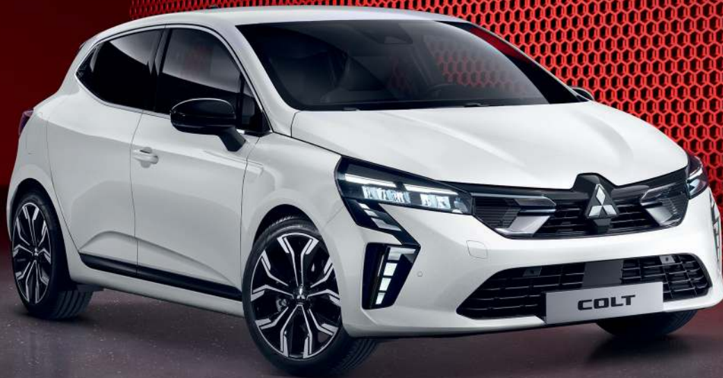
Abb. zeigt COLT Select 1.0 Turbo-Benziner 67 kW (91 PS) 6-Gang