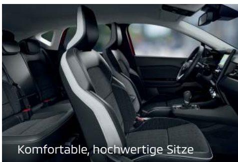
Komfortable, hochwertige Sitze