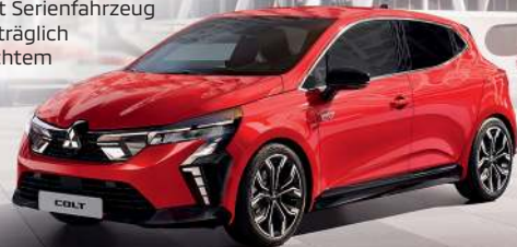
Abb. zeigt Serienfahrzeug mit nachträglich angebrachtem Zubehör.

Eine Fahrradtour mit Ihrem COLT? Nichts leichter als das mit der schwenkbaren Anhängerkupplung und dem abklappbaren Fahrradheckträger. Damit behalten Sie auch problemlos Zugriff zum Kofferraum.