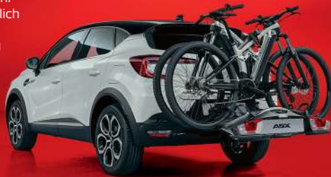
Abb. zeigt Serienfahrzeug mit nachträglich angebrachtem Zubehör. Lieferung ohne Fahrräder.